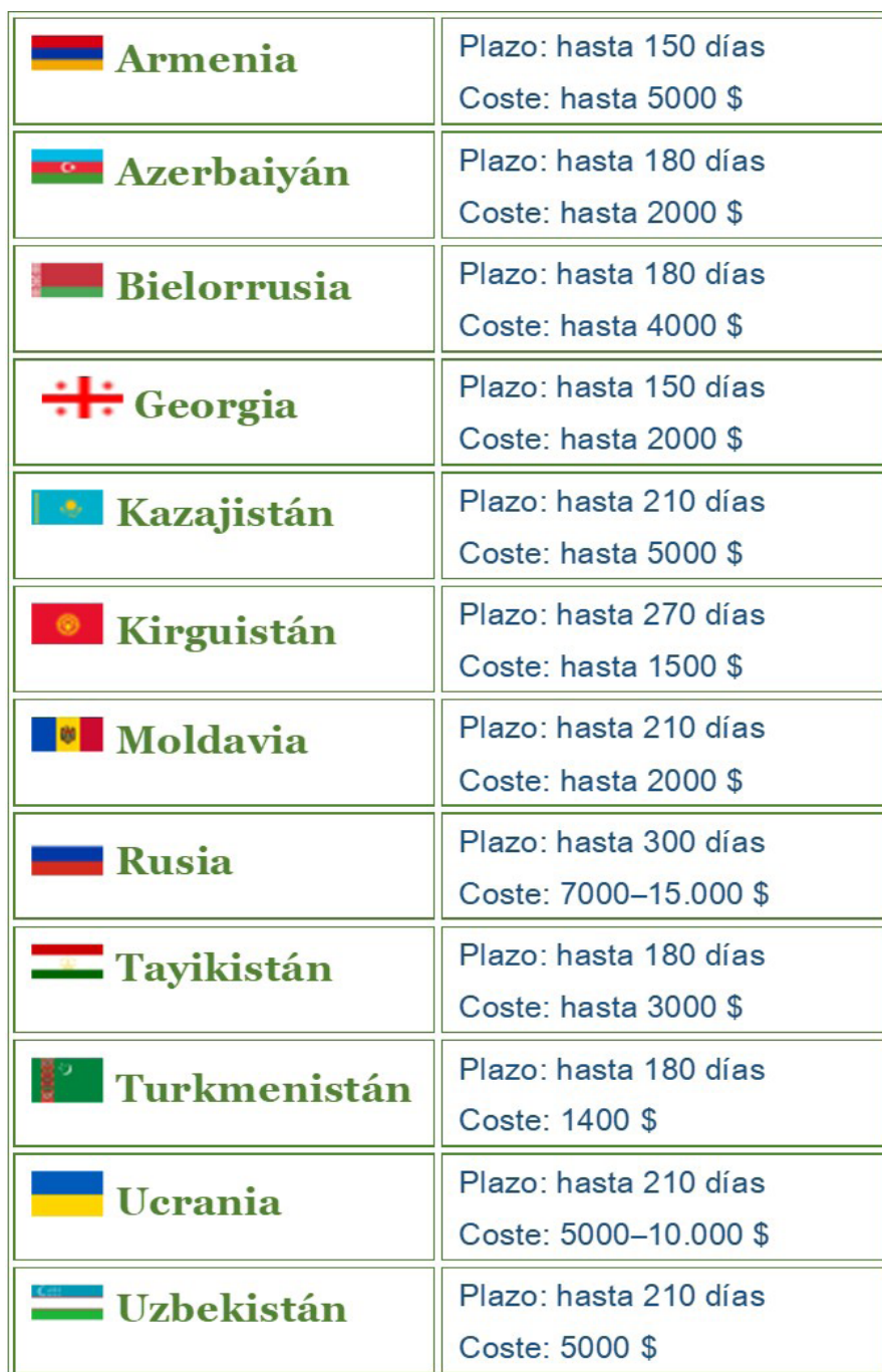
Tabla 1. Plazos y costes del registro de medicamentos en los países CEI (días y dólares USA).

Detrás de una falta de información fiable, una legislación compleja y una pesada burocracia se esconden unos mercados que pueden ser atractivos para la industria farmacéutica española. Eso sí, hay que atreverse y dar un paso adelante ◀◀